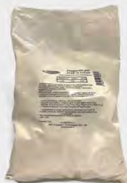
Alimentis Preparato per purè 1 kg