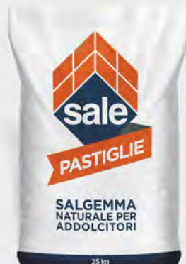
Sale pastiglie 25 kg