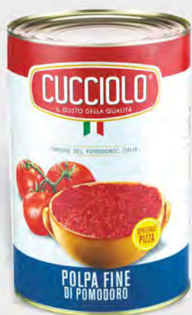
Cuccioio Polpa fine di pomodoro 4,10 kg