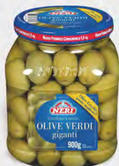
Neri Olive verdi giganti 1,5 kg