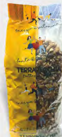
Terranova Noci sgusciate 1 kg