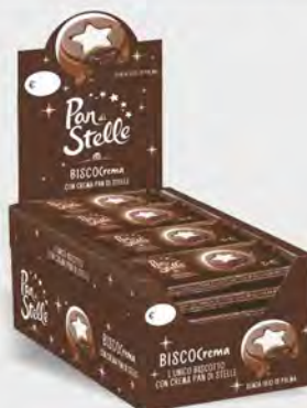
Mulino Bianco Pan di stelle biscocrema 24x28 g