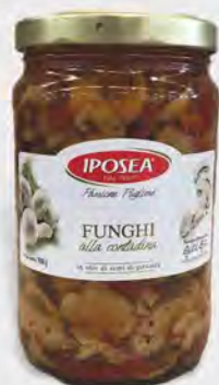
Iposea Funghi alla contadina in olio di semi di girasole 1,7 kg