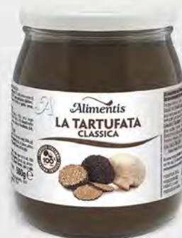
Alimentis La tartufata classica 580 g