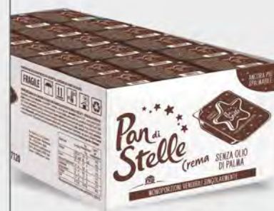
Mulino Bianco Pan di stelle crema 126x15 g