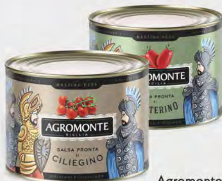
Agromonte Salsa datterino/ cilieginio 2 kg