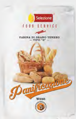
Casillo Farina 0 di grano tenero 25 kg